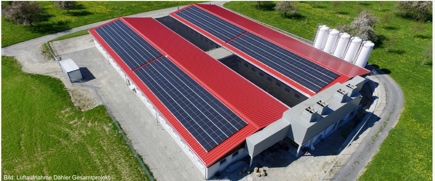
Bild: Luftaufnahme Dähler Gesamtprojekt